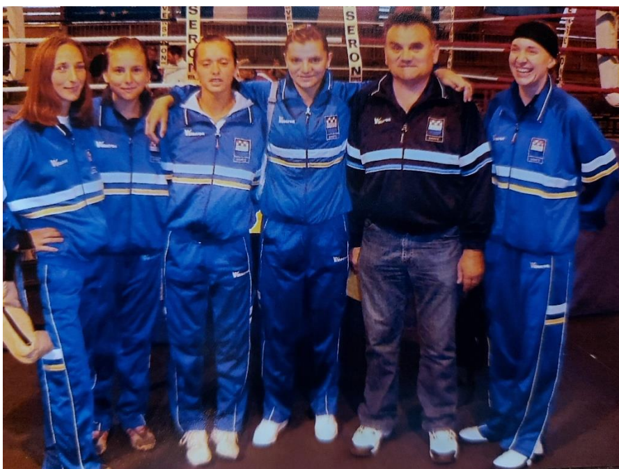
Hrvatska ženska savate combat reprezentacija 2005.godine

Protekla godina prošla je bez natjecanja i iako se klubovi bore i pokušavaju održavati sportsku formu natjecatelja, sigurna sam da će se prekid kontinuiteta natjecanja negativno odraziti na uspješnost naših natjecatelja na međunarodnoj sceni.