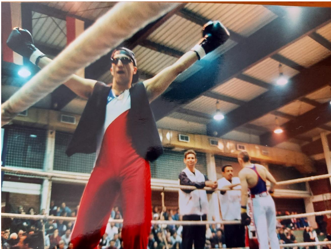
Vinkovci, 18.10.1997.godine, Svjetsko prvenstvo

Svi se sjećamo uspješnih organizacija europskih i svjetskih natjecanja u savateu u Hrvatskoj i popunjenosti sportskih dvorana. Organizacija velikih međunarodnih priredbi značajno pridonosi popularizaciji savatea u Hrvatskoj što dugoročno znači više članova, bolju i jaču konkurenciju te bolje rezultate.